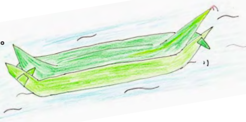
ササ船をつくって、海まで辿りつけるかな・・・