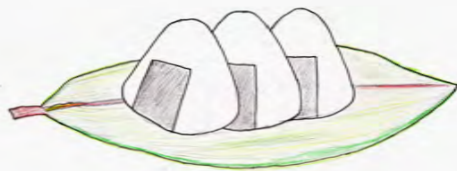
でかける時はおにぎりをササに包んで・・・